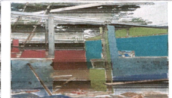
Fabricación e instalación de puerta de metal