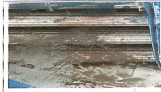
Sustitución de piso cerámico (aula)

Observación: Si es necesario se pueden agregar hojas adicionales y actualizar el número de hojas.