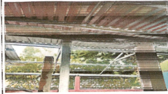
Sustitución de estructura de soporte de maderas por metal