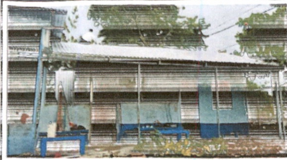
Sustitución de lámina por lámina troquelada aluzinc