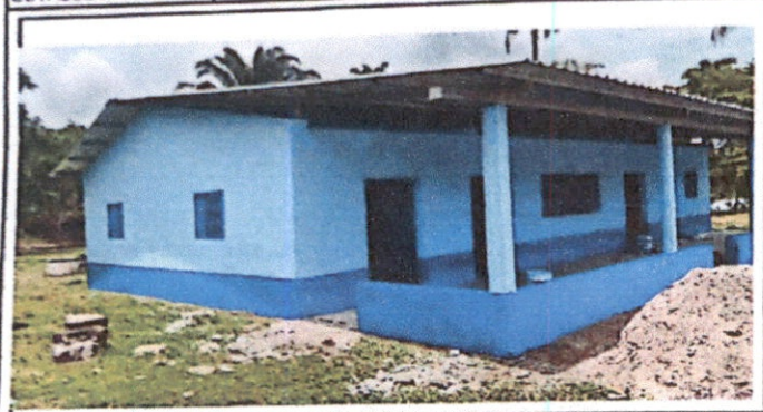
Foto1: Sustitución de lamina, por lámina troquelada Aluzinc calibre 26