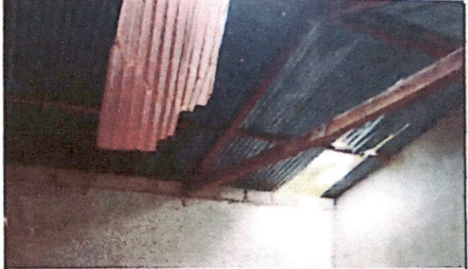
Foto 2: Sustitución de estructura de soporte de madera, por metal