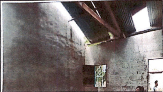
Foto 1: Sustitución de lamina, por lámina troquelada Aluzinc calibre 26