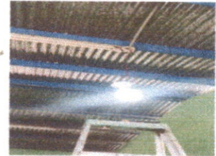
Foto 4: Reparación de sistema eléctrico (cable principal, plafoneras, focos, tomacorrientes, interruptores y flipon)