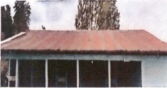
Foto1: Techo de Lamina de las 3 aulas