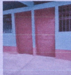
Foto 6: Mantenimiento a estructura (lijado, cambio de tubo, cepillado, sujeciones, aplicación de pintura) a puerta aulas

Observación: Si es necesario, adjuntar número de hojas.