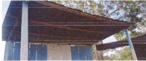
Foto 4: Sustitución de estructura de soporte de madera, por metal modulo escenario