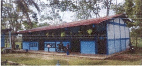
Foto 1: Sustitución de lamina, por lamina troquelada aluzinc calibre 26 modulo de aulas