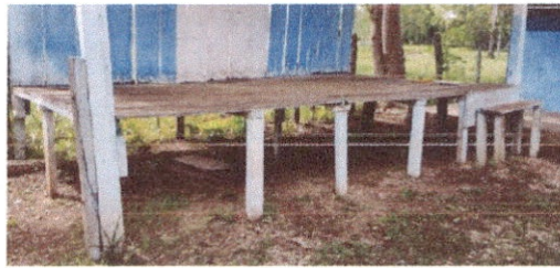
Foto 6: Reparación de muro de escenario de block, piso torta de cemento

Observación: Si es necesario se pueden agregar hojas adicionales y actualizar el número de hojas.