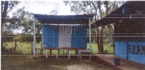
Foto 5: Sustitución de lamina, por lamina troquelada aluzinc calibre 26 escenario