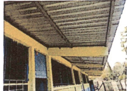
Foto 2: sustitucion de estructura de soporte de metal y cubierta de lamina