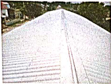
Foto 1: Sustitución de estructura de soporte de madera por metal y sustitución de lamina troquelada