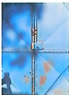
Foto1: Mantenimiento a estructura de porton de metal