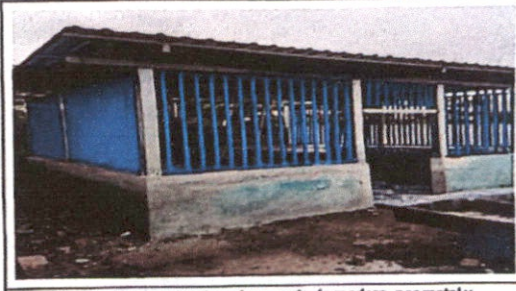
Foto 2: Sustitución de estructura de soporte de madera, por metal y sustitución de lámina