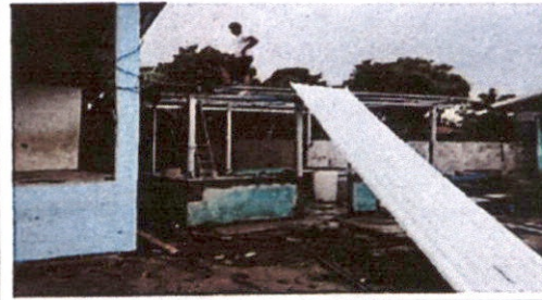
Foto 2: Sustitución de estructura de soporte de madera, por metal y sustitución de lámina