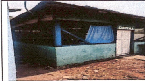
Foto 2: Sustitución de estructura de soporte de madera, por metal y sustitución de lámina