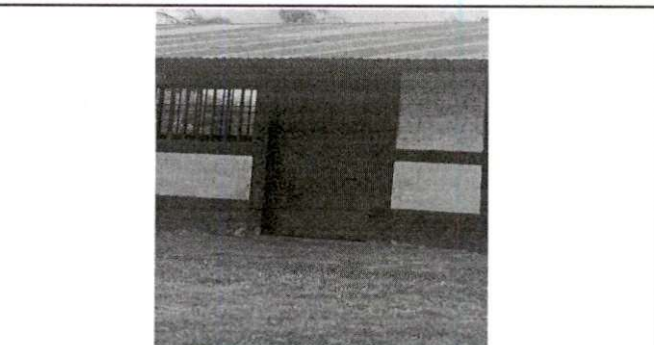
Foto 05. Mantenimiento a estructura de puertas de metal