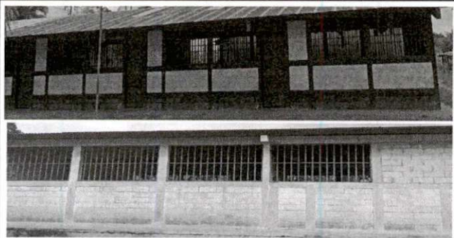
Foto 03. Mantenimiento de balcones de metal