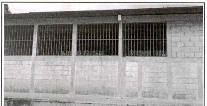
Foto 06. Pintura en muros exteriores

Observación: Si es necesario se pueden agregar hojas adicionales y actualizar el formato de Hojas.