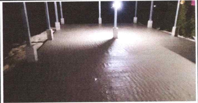
SUSTITUCIÓN DE TORTA DE CONCRETO