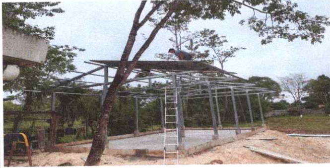
SUSTITUCIÓN DE LAMINA, POR LAMINA TROQUELADA ALUZINC CALIBRE 26