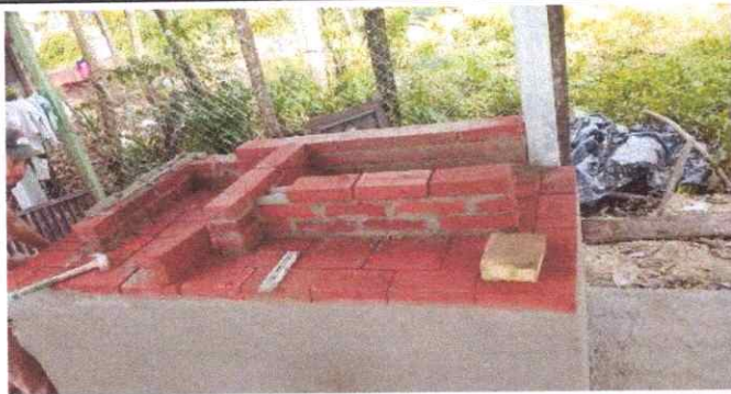
MANTENIMIENTO A ETUFA RURAL