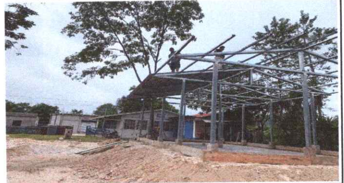
SUSTITUCIÓN DE ESTRUCTURA DE SOPORTE DE MADERA POR METAL