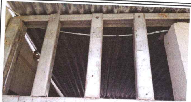
SUSTITUCIÓN DE ESTRUCTURA DE SOPORTE DE MADERA POR METAL