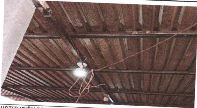
SUSTITUCIÓN DE LAMINA, POR LAMINA TROQUELADA ALUZINC CALIBRE 26