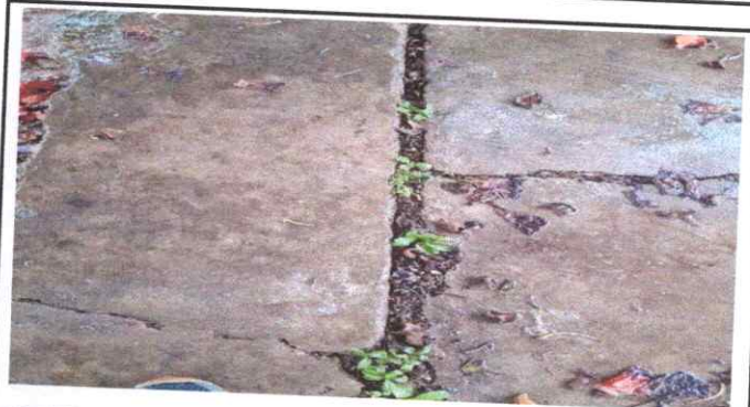
SUSTITUCIÓN DE TORTA DE CONCRETO