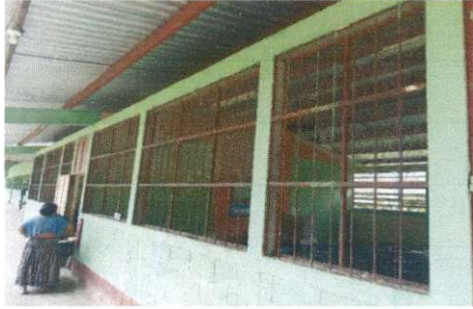
Foto1: Sustitución de balcones-Fabricación e instalación de balcones de hierro en ventana