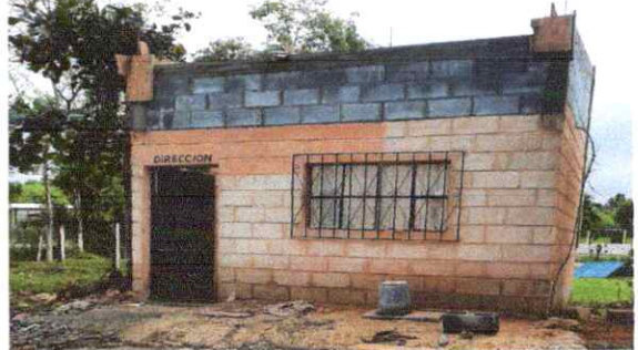
Foto 2: Sustitución de estructura de soporte de madera, por metal