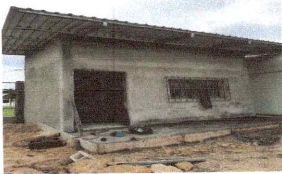
Foto 3: Repello y cernido en muro, reparación de piso de cemento líquido