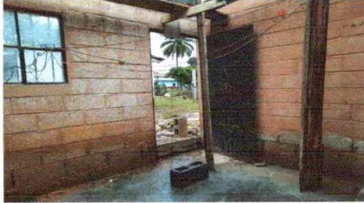
Foto1: Repello en muro y pared