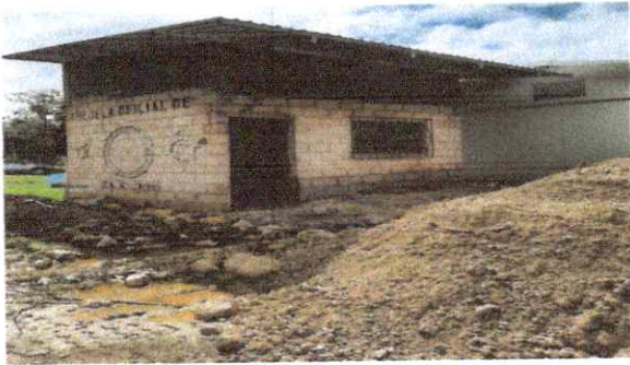
Foto 1: Sustrucción de lámina, por lámina troquelada aluzinic calibre 26