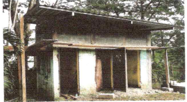
Foto 2: Sustrucción de lámina, por lámina troquelada aluzinic calibre 26