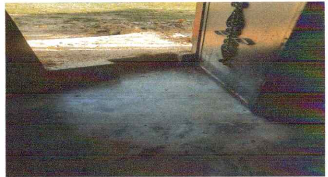
Foto 4: Sustrucción de piso de cemento liquido, mantenimiento puerta de metal