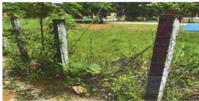
Foto 5: Reparación de muro perimetral deblock, Reparación malla galvanizada