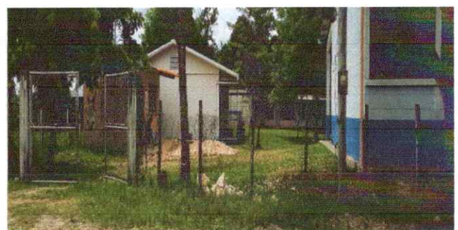
Foto 6: Sustrucción de Portón de metal, Reparación malla galvanizada

Observación: Si es necesario se pueden agregar hojas adicionales y actualizar el número de hojas.