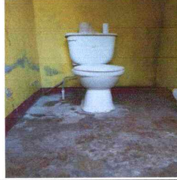
Foto 2: Sustrucción inodoro, columnas, repello en muro, cernido en muro, Sustrucción piso cerámico, pintura en muro exteriores e interiores