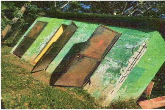
Foto1: Sustrucción de Puerta en servicio sanitarios, Sustrucción de estructura de soporte metal, por metal. Sustrucción de lámina por lamina troquelada calibre 26, pintura en muro exteriores e interiores