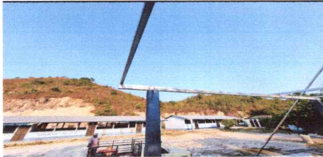
Instalación es estructura portante de metal