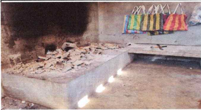
Foto1: Reparación de estufa rural completa