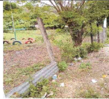
Cerco perimetral del escuela en mal estado de la malla