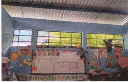
Foto1: Falta ventanas y balcones