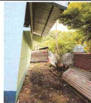
Falta de cunetas de la parte de atrás de las aulas, canales y bajadas de agua pluvial con tubo PVC

Observación: Si es necesario se pueden agregar hojas adicionales y actualizar el número de hojas.