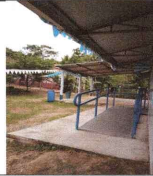
Piso de corredor en mal estado