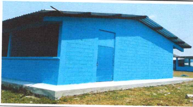
Foto1: Instalación de puerta de metal