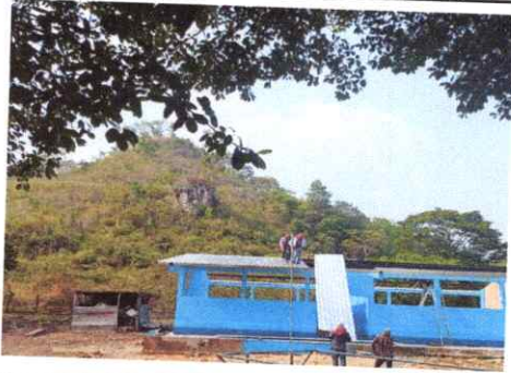
Foto1: instalación de techo