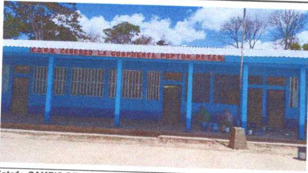
Foto1: CAMBIO DE PINTURA PRIMER BLOQUE.