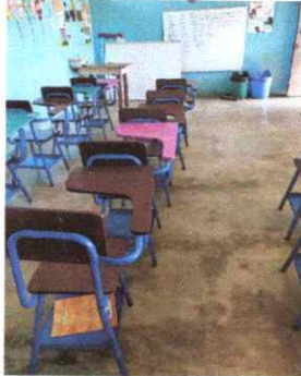
Foto1: Sustitución de piso de torta de concreto