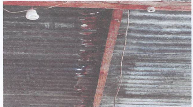
Techo del aula de sexto A