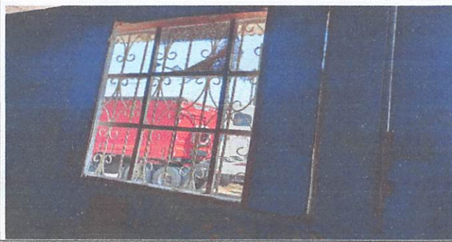
Ventanal de las aulas de sexto grado