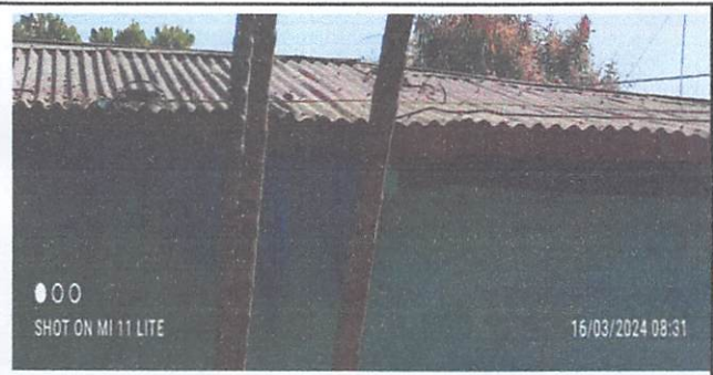
Entechado de las aulas de las tres secciones de sexto y la dirección

Observación: Si es necesario se pueden agregar hojas adicionales y actualizar el número de hojas.