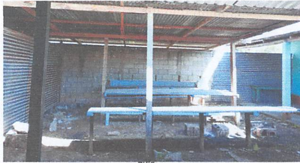
Area de cocina y comedor escolar