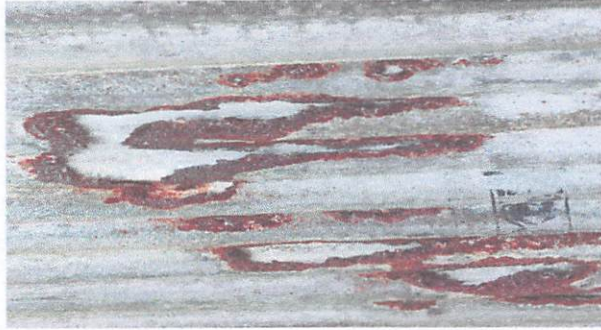
Techo del aula de sexto B