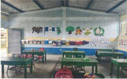
Foto1: Pintura en muros exteriores e interiores