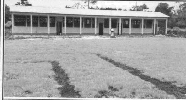
Foto1: SUSTITUCION DE LAMINA POR LAMINA TROQUELADA