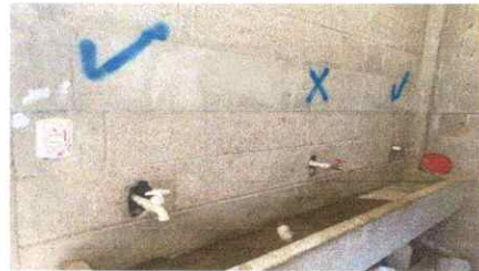
Aplicación de azulejo a pared de lavamanos de los baños