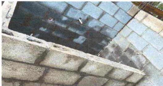
Elaboración de una pila