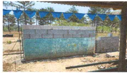
Suministro y elaboración de Pared y cocina terminadas