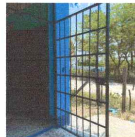
Instalación de puerta de metal