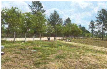
Instalación de un Portón principal