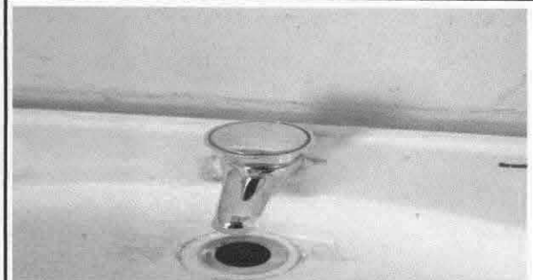
Cambio de glifos