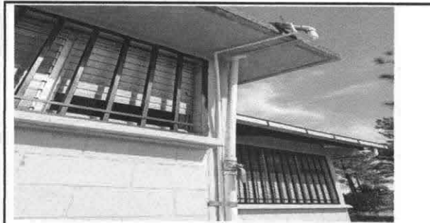
Sustitución de tubería principal