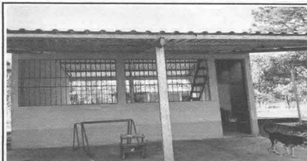
Sustitución de piso de torta de concreto

Observación: Si es necesario se pueden agregar hojas adicionales y actualizar el número de hojas.