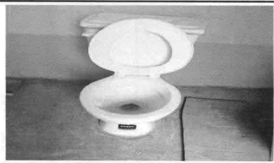
Sustitución de inodoros