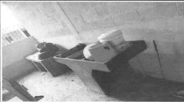
Sustitución de pila de concreto de 2 lavaderos