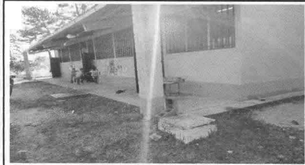
Pintura de interiores y exteriores