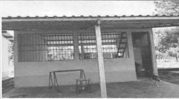
Sustitución de lámina por lámina troquelada aluzinc C2 y sustitución de canales de lámina troquelada