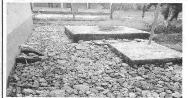
Limpieza de fozas septica