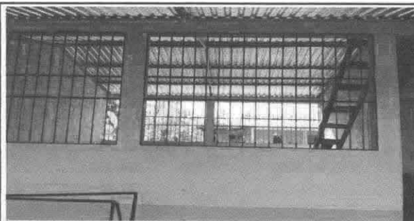
Mantenimiento de balcones