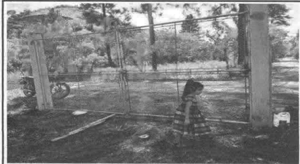
Sustitución de portón