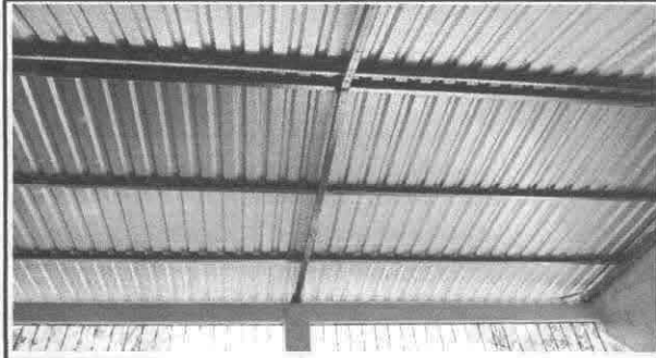
Sustitución de estructura de soporte de madera por metal