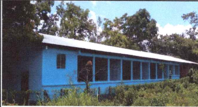
Foto1: POSTERIOR TERMINADA