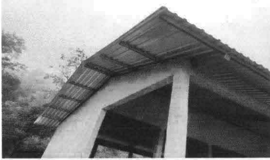
Foto1: Sustrucción de lamina