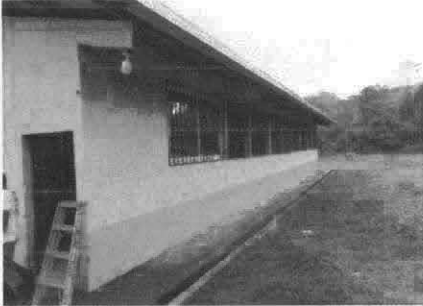
Instalación de unidades de Luz