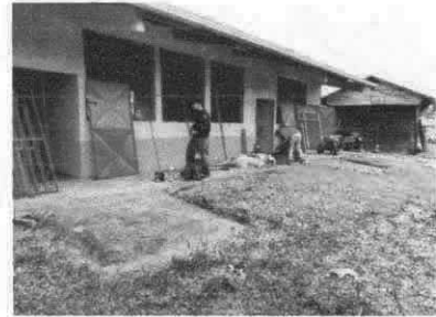
Sustitución de chapas