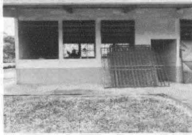
Sustitución de balcones de metal