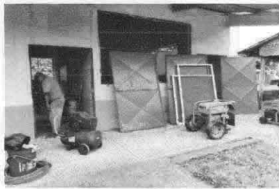
Mantenimiento a estructuras (lijado, cambio de tubo, cepillado, sujeciones, aplicación de pintura)