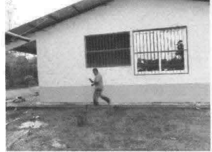
Instalación de ventana