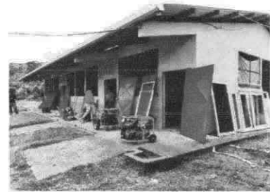
Fabricación e instalación de puertas de metal en módulos

Observación: Si es necesario se pueden agregar hojas adicionales y actualizar el número de hojas.