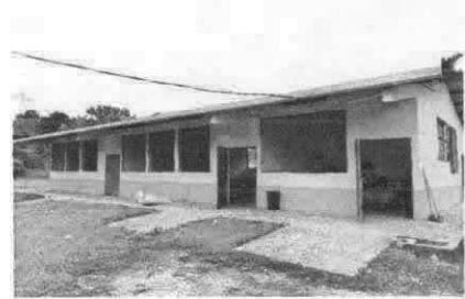
Pintura en muros exteriores e interiores