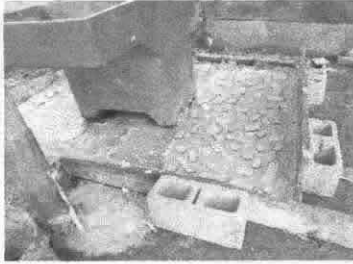
Reparación de torta de concreto

Observación: Si es necesario se pueden agregar hojas adicionales y actualizar el número de hojas.