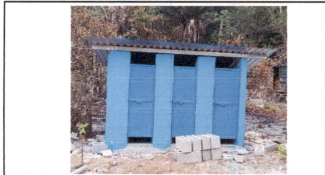
Foto1: Construcción de baños