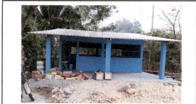
Foto 3: Reparación de techo, sustitución de estructura, techo y puerta.