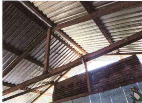
Foto 4: Sustitución de lámina, por lámina troquelada aluzinc calibre 26 Sustitución de elementos de fijación en cubierta de lamina