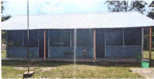
Foto1: Pintura en muros exteriores e interiores