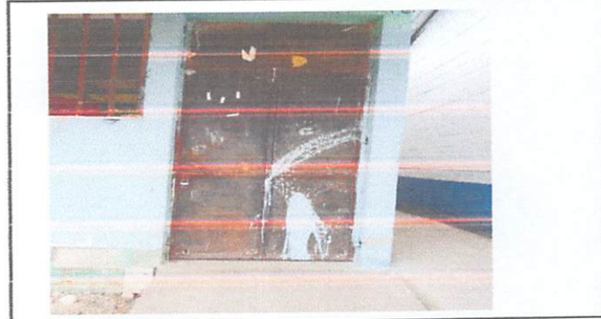
Cambio de puertas de metal (4 puertas)