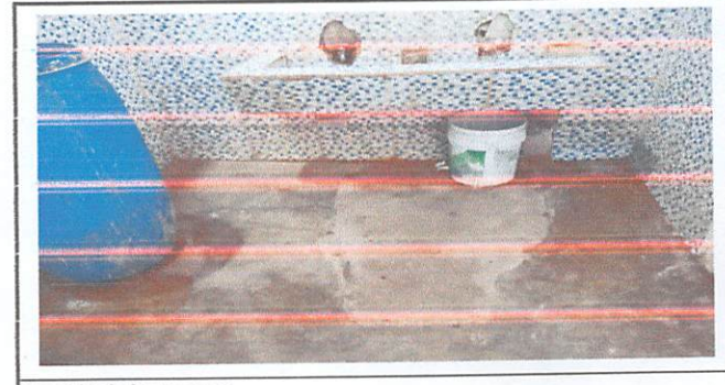
Cambio de lavamanos.

Observación: Pueden agregar hojas adicionales y actualizar el número de hojas.