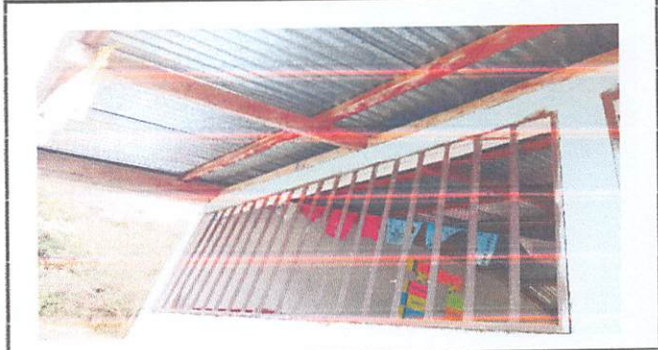
Foto 2. Techo en mal estado