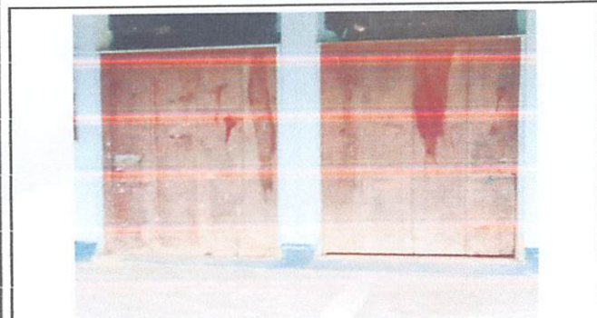
Cambio de puertas de madera a metal (6 puertas)