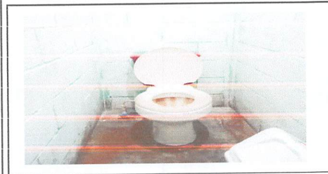
4 tazas en mal estado.