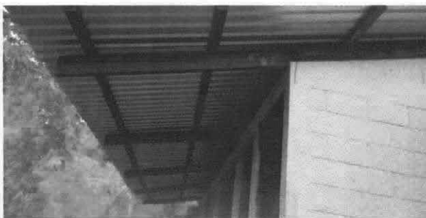
Sustitución de lámina troquelada aluzinc calibre 26