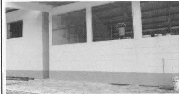
Foto7: Pintura en muros exteriores