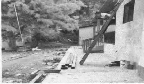
Foto1: Instalación de estructura portante