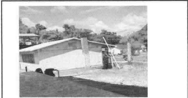
Foto 1: Tallado de columnas y un cimiento para instalar el portón