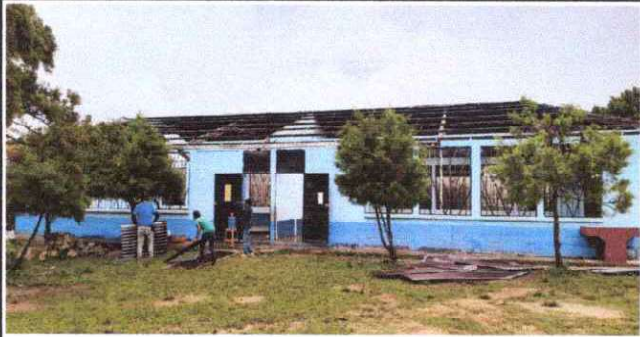
Foto1: cambio de Lamina dañada