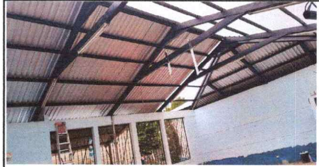
cambio lamina y estructura dañadas