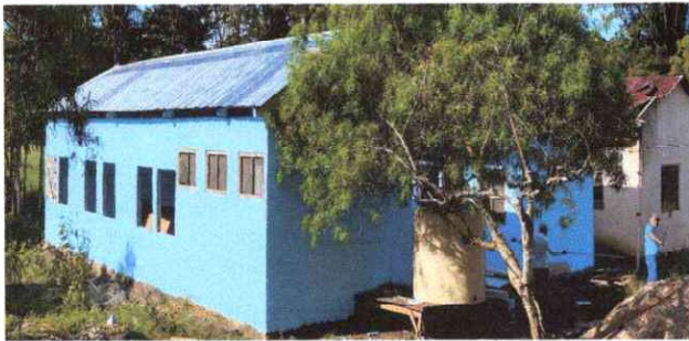
Foto1: SUSTITUCION DE LAMINA POR LAMINA TROQUELADA ALUZINC CALIBRE 26 Y ELEMENTOS DE FIJACION