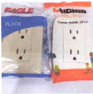
Foto7: TOMA CORRIENTES DONLES