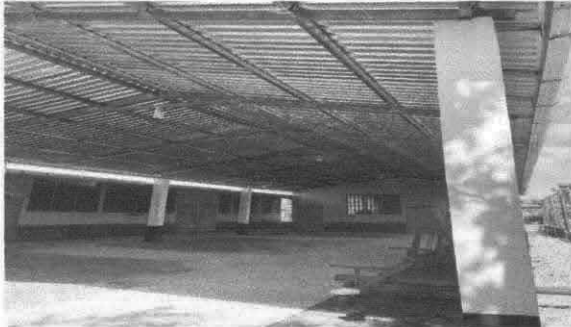
Foto1: INSTALACIÓN DE LÁMINA TROQUELADA ALUCÍN CALIBRE 26