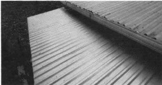
Foto1: Cambio de techo