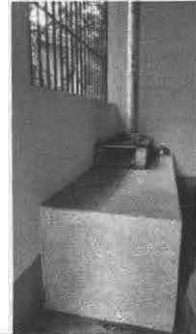
Foto 2: Sustitución de estufarural (Completa) Incluye chimenea y plancha de metal