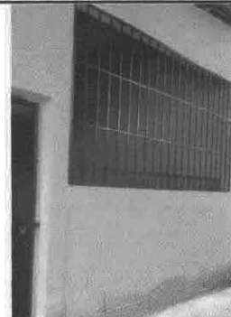
Foto 4: Fabricación e instalación de balcones de hierro en ventana