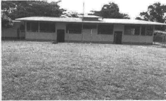
Foto1: Pintura En muros exterior e interior