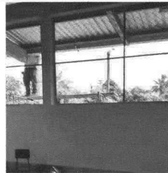
Foto 4: Fabricación e Instalación de balcones de hierro en ventana