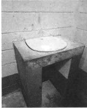
Foto1: Sustitución de Lavamanos