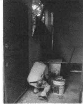
Foto 2: Sustitución de estufarural (Completa) Incluye chimenea y plancha de metal