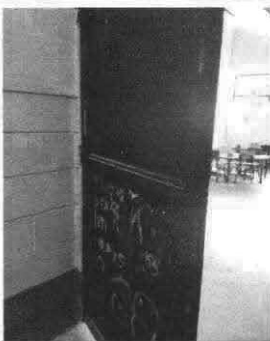
Foto 5: Mantenimiento de Estructura ( Lijado ,cambio de tubo,cepillado,sujeciones,aplicación,pintura)