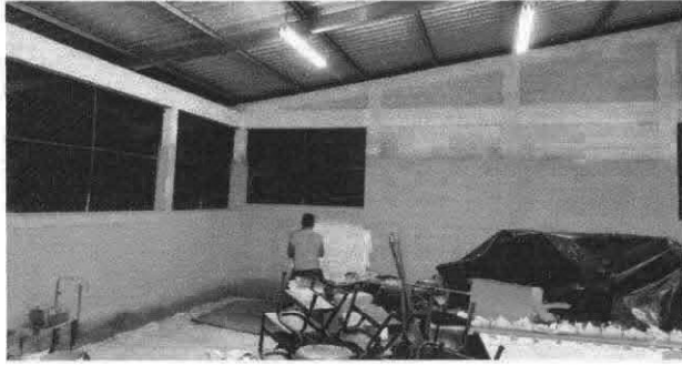
Foto1: Pintura En muros exterior e interior