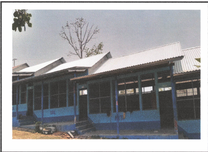
Foto1: Sustitución de lámina, por lámina troquelada aluzinc calibre 26