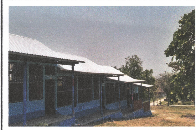
Foto 4: Sustitución de estructura de soporte de madera, por metal.