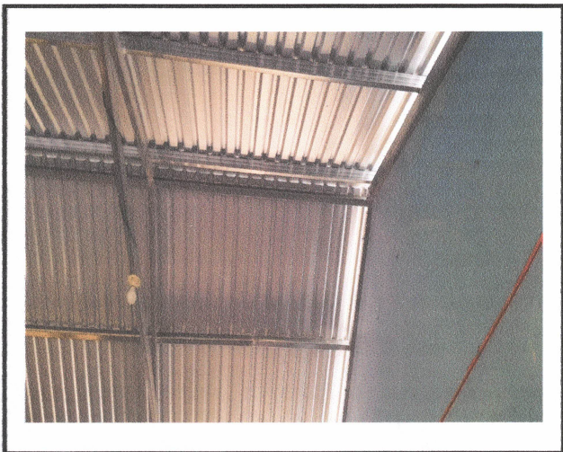
Foto 2: Sustitución de estructura de soporte de madera, por metal.