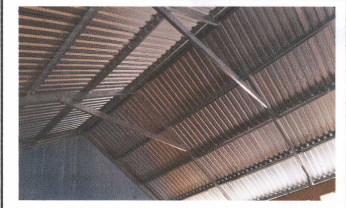
Foto 3: Sustitución de estructura de soporte de madera, por metal.