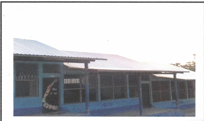
Foto 5: Sustitución de estructura de soporte de madera, por metal.