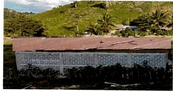
1.1 Sustitución de lámina por lámina troquelada alizinc calibre 26