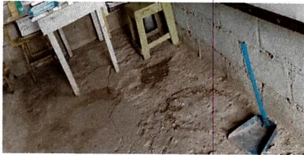
6.5 Sustitución de piso de torta de concreto