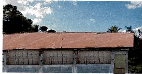
19.2 Fabricación e instalación de balcones de hierro en ventana.