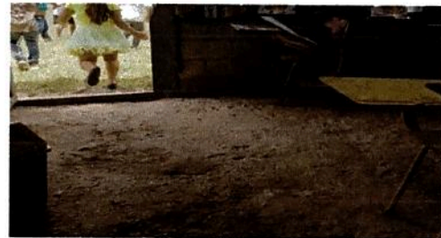
6.5 Sustitución de Piso de torta de concreto de aula

Observación: Si es necesario se pueden agregar hojas adicionales. No se permite el uso de hojas.