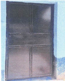
Foto 3: Mantenimiento a estructura (lijado, cambio de tubo , cepillado, sujeciones, aplicación de pintura)