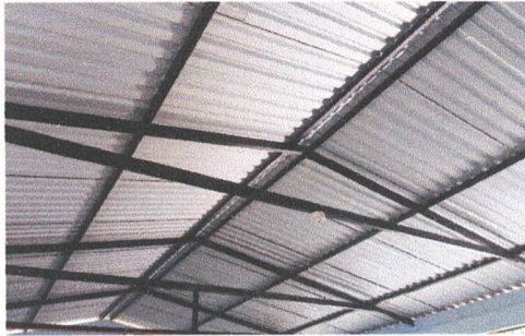
Foto 1: Sustitución de lámina, por lámina troquelada aluzinc calibre 26