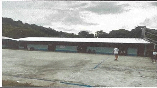
Foto 1 Renglon 2.2 Sustitución de estructura de soporte de madera, por metal