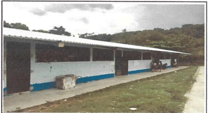
Foto 2 Renglon 1.1 Sustitución de lamina por lamina troquelada de calibre 26