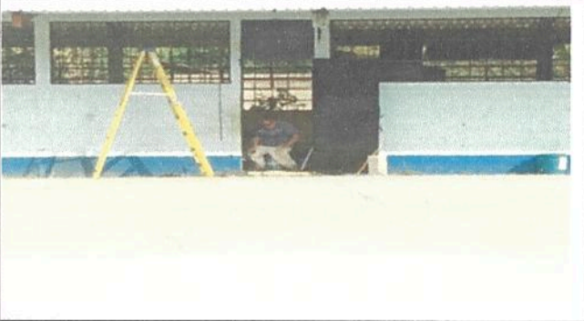
Foto 4 Renglon 4.3, sustitución de puertas en modulos