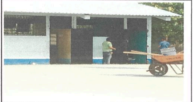
Foto 4 Renglon 4.3, sustitución de puertas en modulos