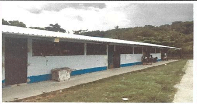
Foto 5 Renglon 19.2, Fabricación e instalación de balcon de hierro en ventana