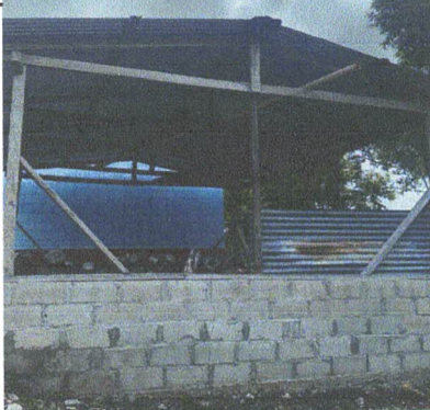
MANTENIMIENTO DE COCINA