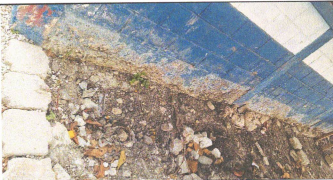
REPELLO PAREDES DE SALON DE CLASES