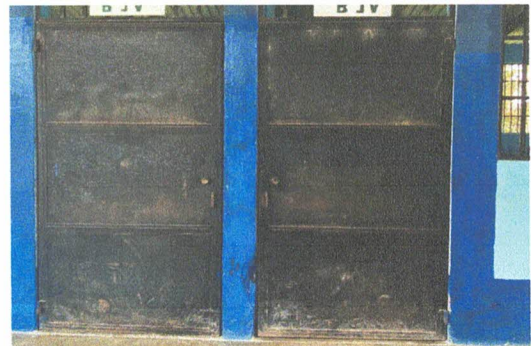
MANTENIMIENTO Y SUSTITUCIÓN DE PUERTAS DE METAL