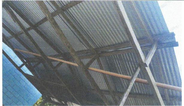
SUSTITUCION DE TECHO